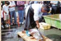
クエ・フェア(クエの解体)

10月〜翌3月頃: クエ料理旬を迎える。 クエ・フェア(比井崎漁業協同組合市場) クエ祭(阿尾白鬚神社) 比井祭、志賀祭、内原祭等