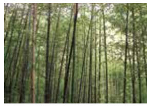
熊野古道沿いに群生する黒竹