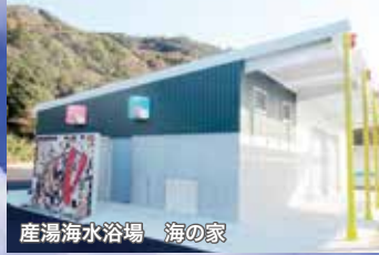
産湯海水浴場 海の家