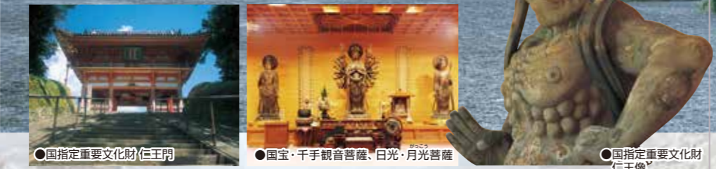
●国指定重要文化財(仁王門) ●国宝・千手観音菩薩、日光・月光菩薩 ●国指定重要文化財(仁王像)